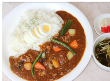
季節の野菜カレー