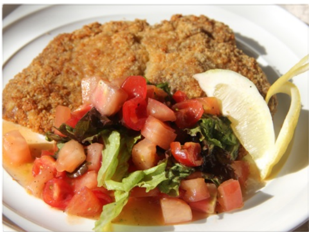
ミラノ風カツレツ