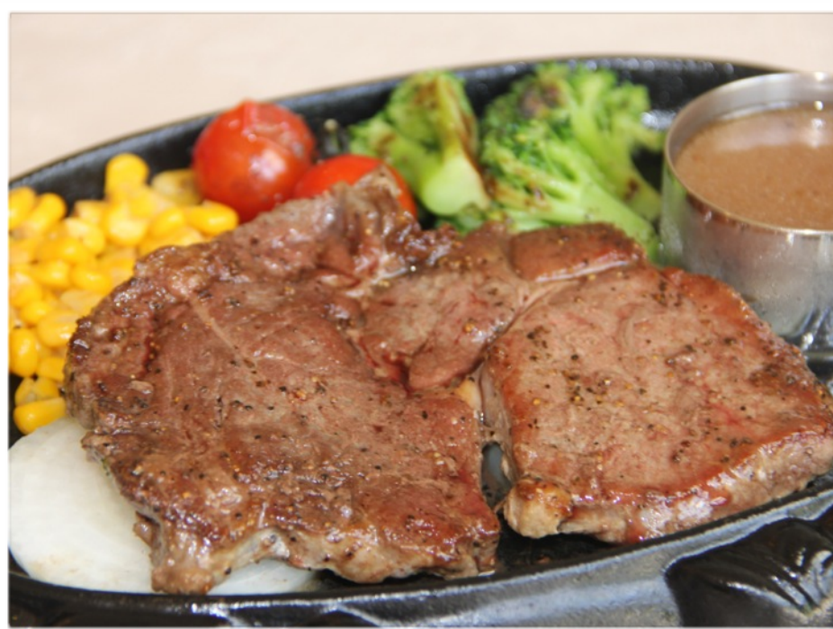
シェフズ・ステーキ