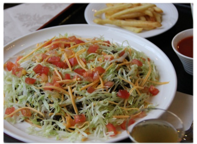
タコライスプレート

ミラノ風のビーフカツレツです。 トッピングのトマトの酸味が、すっきりと して飽きのこない1品です。